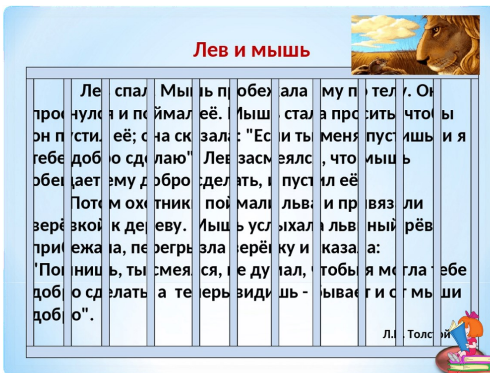
Рис.1. – Активные методы при работе с текстом

Если у ребенка малое поле зрения, то можно использовать таблицы Шульте, которые способствуют расширению поля зрения (рис. 2).