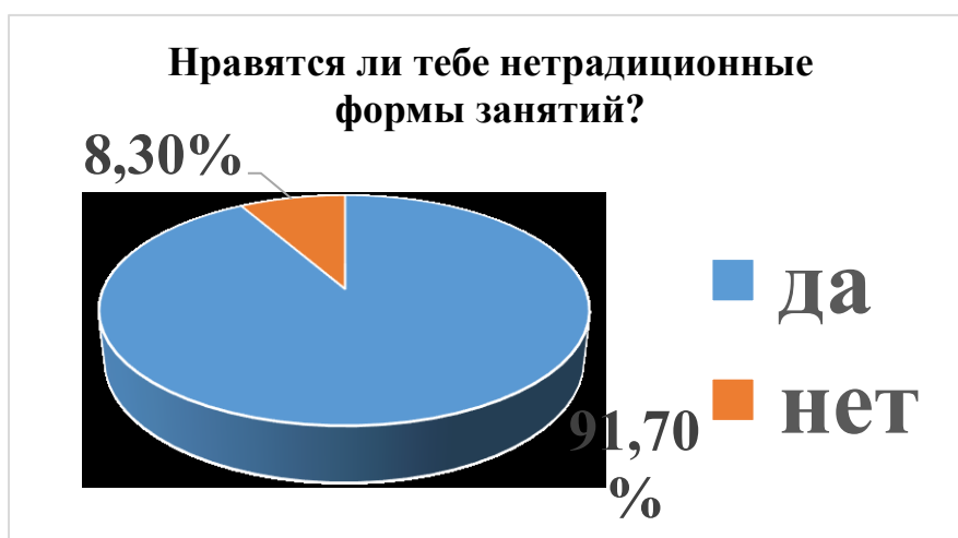
Рис. 1. Анализ ответов обучающихся

Им был задан вопрос «Нравятся ли тебе нетрадиционные формы проведения занятий?» и были получены следующие результаты: 91,70% ответили, что нестандартные занятия им нравятся, а 8,30% обучающихся сказали, что такой вид занятий им не нравится (рис. 1).