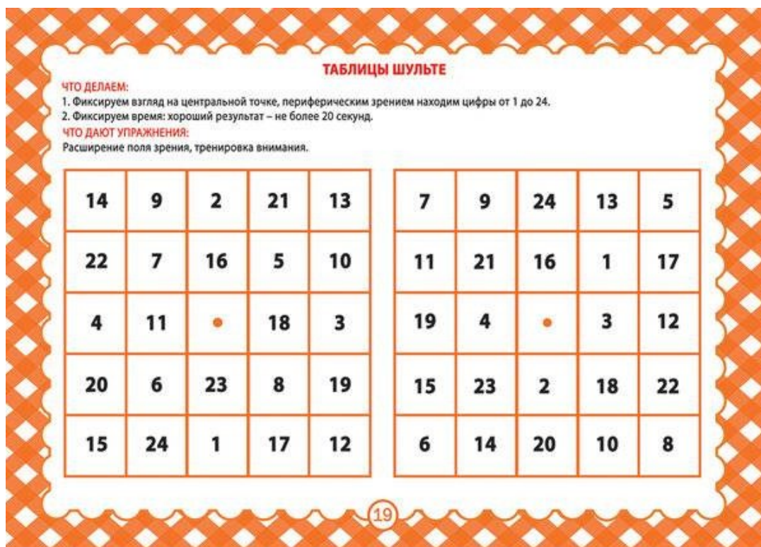
Рис.2. – Пример таблицы Шульте

Если у ребенка малое поле зрения, то можно использовать таблицы Шульте, которые способствуют расширению поля зрения (рис. 2).